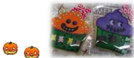
※写真はイメージです

小麦・卵などを使用します。 アレルギー対応はできません。 食材に関して、詳しくは、お問合せください。