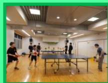
前回の様子(平成31年1月12日)