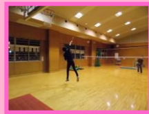
前回の様子(平成30年12月15日)