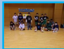
前回の様子(平成30年12月22日)