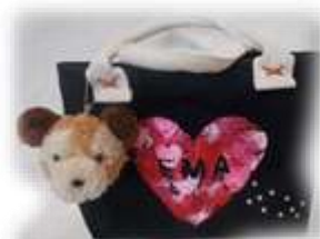
※写真はイメージです。 バッグ中央の模様を選べます。

【内容】 ①バッグ …・好きな模様の型を選ぶ。 ・スタンプで絵付けする。（ステンシル） ②ストラップ…ポンポンメーカーを使ってくまやペンギンなどを作成。