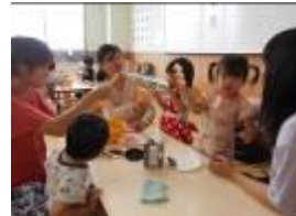
←おにぎりパーティー