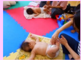
▲画像は前回の講座の様子