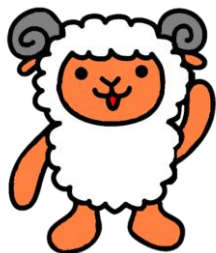
イメージキャラクター 『くめ〜』